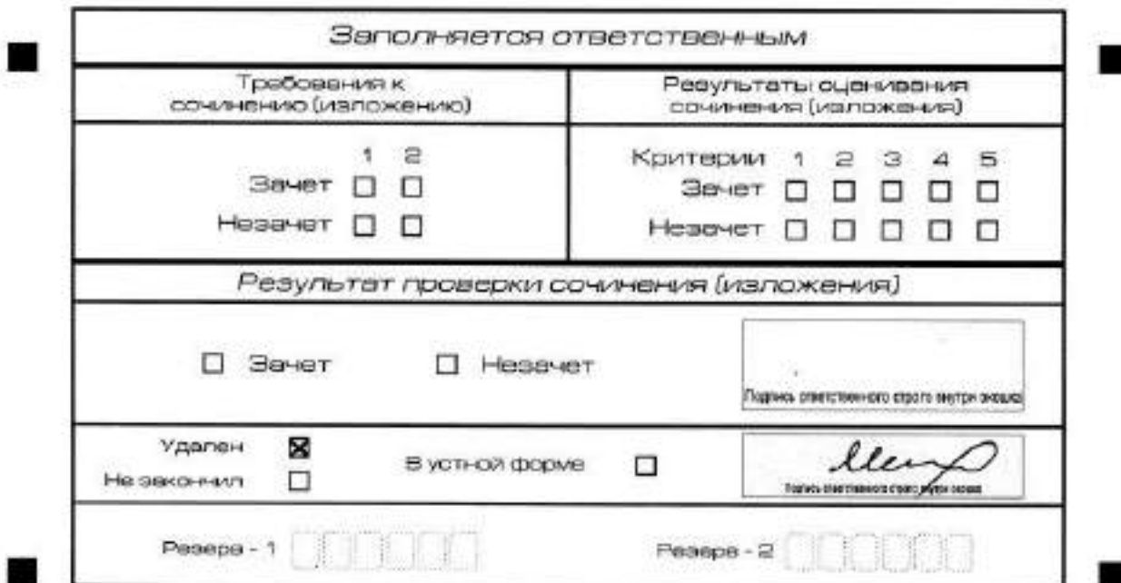
Рис. 12. Заполнение полей нижней части бланка регистрации (удаление с экзамена)

отметку в форму ИС-05 «Ведомость проведения итогового сочинения (изложения) в учебном кабинете ОО (месте проведения)» (участник итогового сочинения (изложения) должен поставить свою подпись в указанной форме). В бланке регистрации указанного участника итогового сочинения (изложения) необходимо внести отметку «X» в поле «Удален». Внесение отметки в поле «Удален» подтверждается подписью члена комиссии по проведению итогового сочинения (изложения) (рис. 12).