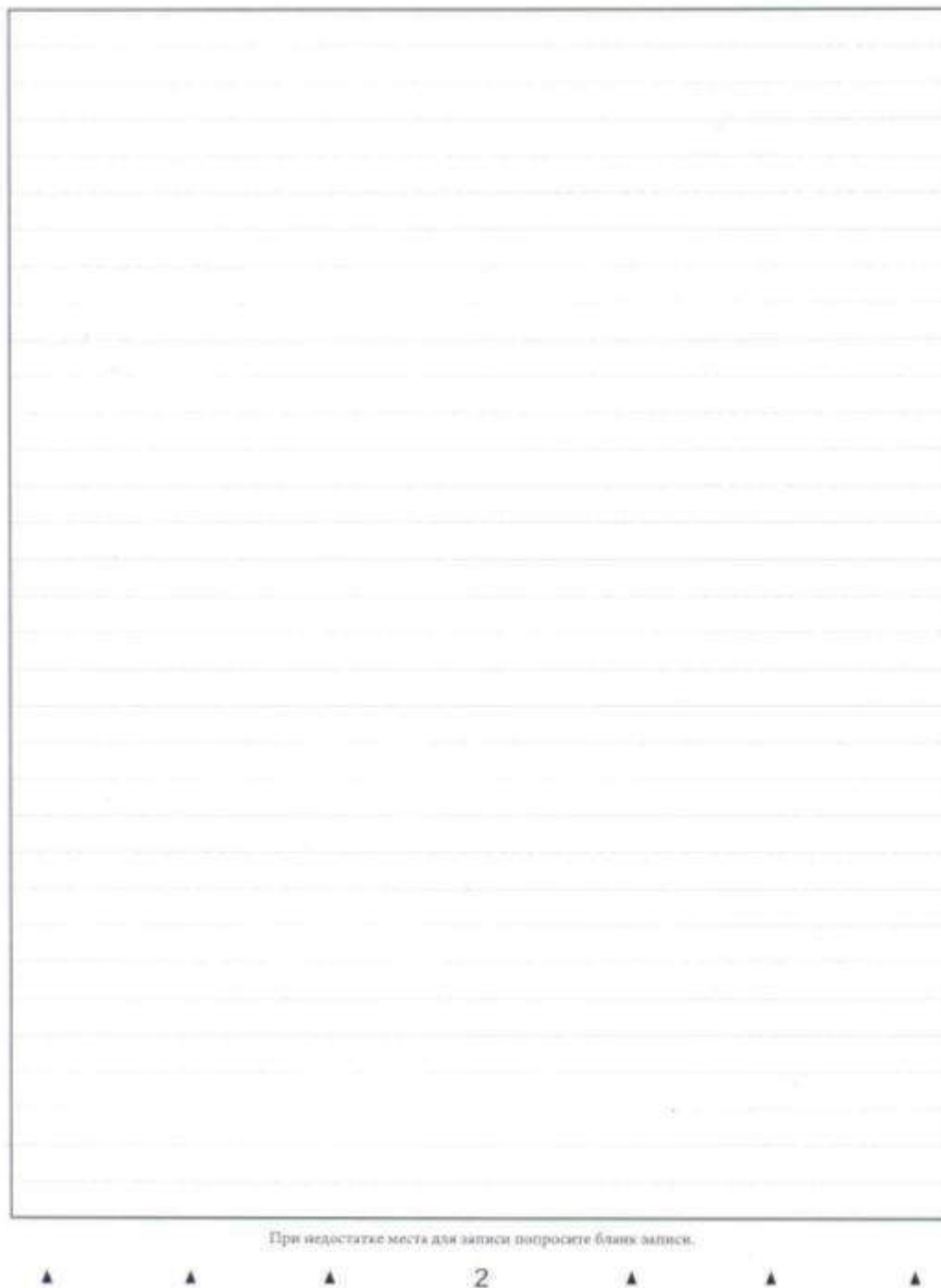
Рис. 6. Обратная сторона двустороннего бланка записи

4.4. В случае использования двустороннего бланка записи при недостатке места для оформления итогового сочинения (изложения) на лицевой стороне бланка записи участник может продолжить записи на оборотной стороне бланка (рис. 6), сделав внизу лицевой стороны запись «смотри на обороте».