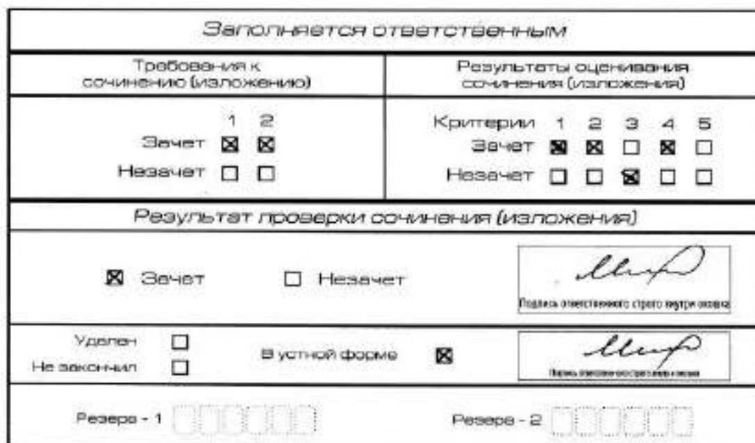
Рис. 10. Область для оценки работы сочинения (изложения) в устной форме

После окончания заполнения бланка регистрации ответственное лицо ставит свою подпись в специально отведенном для этого поле.