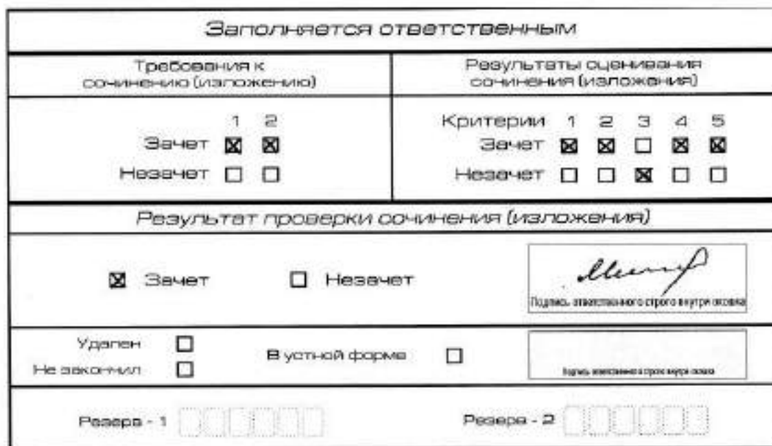
Рис. 9. Область для оценки работы

5.3.3. Во всех остальных случаях итоговое сочинение (изложение) проверяется по всем пяти критериям и оценивается по системе «зачет»/«незачет».