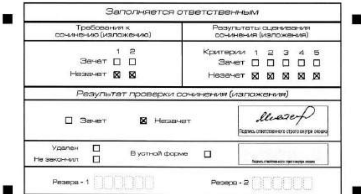
Рис. 7. Область для оценки работы

Выставляется «незачет» за невыполнение требования №2. В клетки по всем критериям оценивания выставляется «незачет». В поле «Результат проверки сочинения (изложения)» ставится «незачет» (рис. 8).